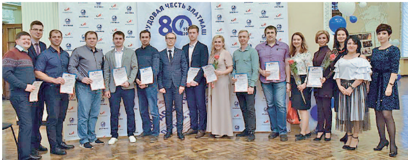
Пишем историю завода вместе! К заводчанам — с благодарностью.

— За 15 лет моей работы на Златмаше в газете я фигурировал не раз. Признаться, фотографии, ста-