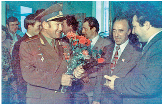
14 июля 1978 года лётчик-космонавт, дважды Герой Советского Союза, генерал-майор Алексей Архипович Леонов побывал на Златоустовском машиностроительном заводе и ознакомился с производством.

Приземление космического корабля «Восход-2» осуществлялось с помощью тормозной двигательной установки производства Златоустовского машиностроительного завода. Специалисты шути называли её мягким тормозом. Посадка корабля должна была состояться после 17 витков в автоматическом режиме, но автоматика не сработала. Командир корабля Павел Беляев вручную ориентировал корабль и включил тормозной двигатель, благодаря чему корабль и совершил посадку.