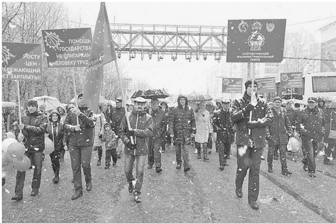
ЧТО МНЕ СНЕГ, ЧТО МНЕ ЗНОЙ...

На сегодняшний день 88% заводчан — члены профсоюзной организации АО «Златмаш». Многие заводчане пришли на Первомайскую демонстрацию вместе со своими детьми и внуками. Улыбки, поздравления и яркие воздушные шары —