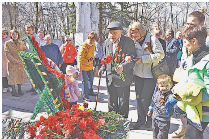
ПОКЛОНИМСЯ ВЕЛИКИМ ТЕМ ГОДАМ.