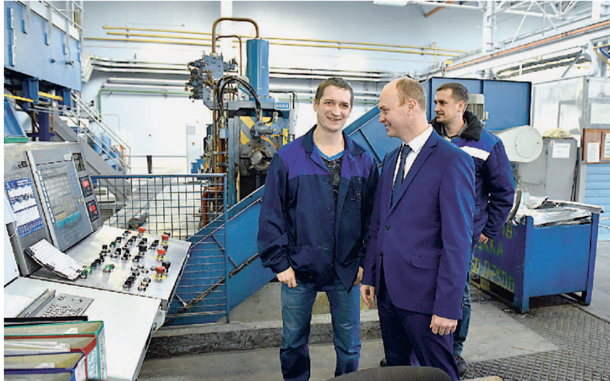
На производстве алюминиевого профиля.