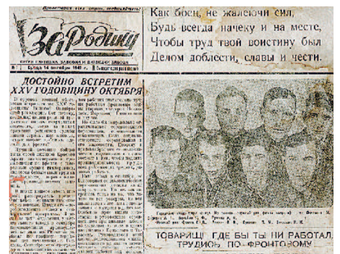
14 ноября 1942 г. Первый номер.

Уважаемые заводчане! Напоминаем вам, что в этот юбилейный для нашего издания год мы открыли новую рубрику «Пишем историю завода ВМЕСТЕ!», в которой будем публиковать интересные факты из истории газеты.