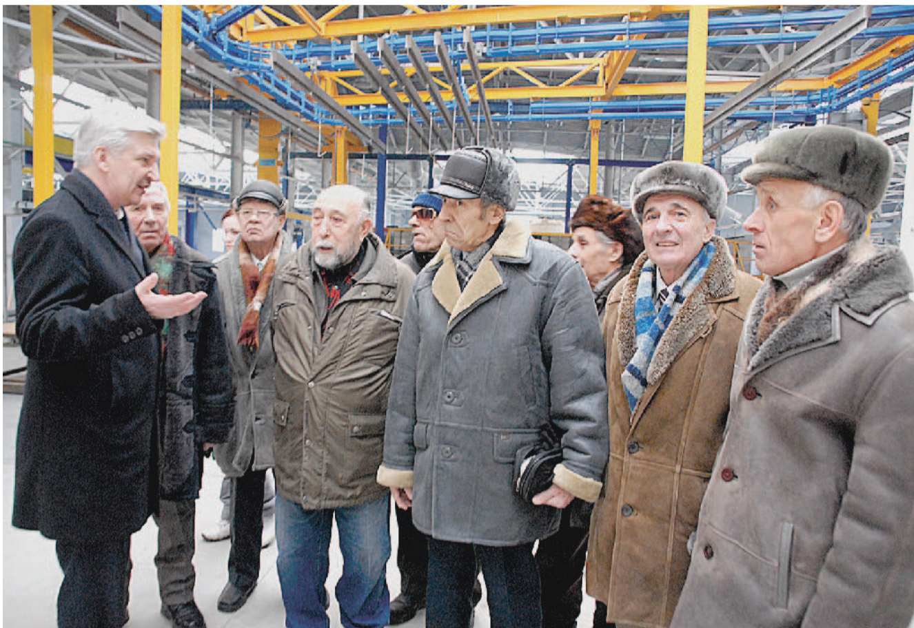
НА ЭКСКУРСИИ. Ветераны по достоинству оценили новое производство алюминиевого профиля.

По информации пресс-службы Собрания депутатов Златоустовского городского округа.