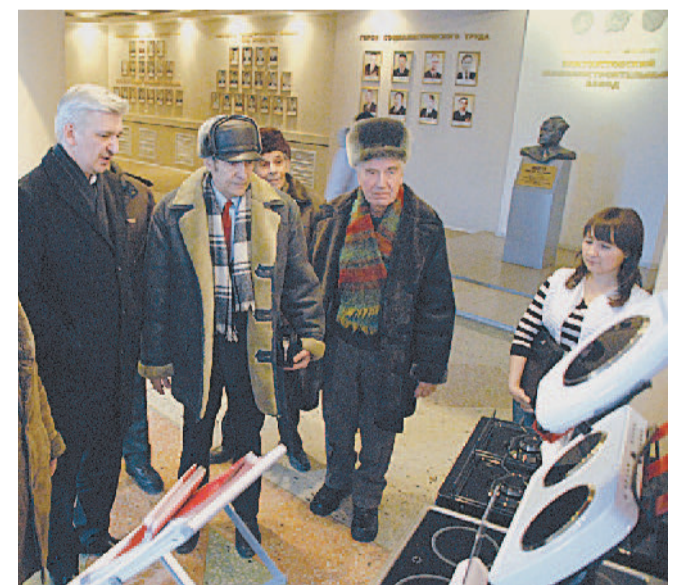
Особенно ветеранов впечатлили бытовые плиты «Мечта».