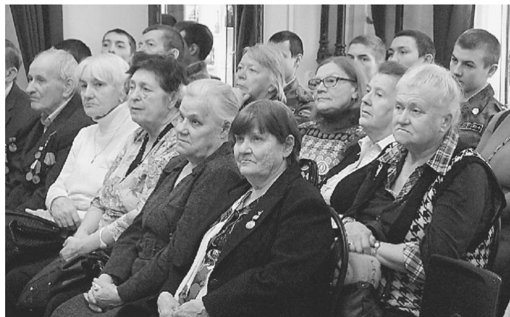
ЛЕНИНГРАДЦЫ. В Златоусте их осталось всего 20.