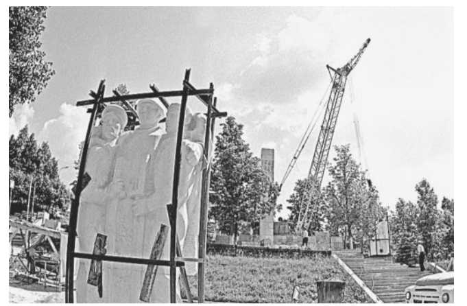
Установка скульптурных групп.

9 мая 1975 года задолго до начала митинга территорию вокруг обелиска заполнили тысячи новозлатоустовцев. Пришли сюда ветераны войны и труда, грудь которых увешана орденами и медалями за подвиги на фронте и в тылу, пришли те, кто продолжает трудовую эстафету дедов, отцов и матерей в мирное время, пришли пионеры и школьники, которые примут эстафету у старшего поколения. У всех одно желание: воздать почести героям фронта и тыла, почтить память тех, кто не вернулся с войны. На лозунге, что