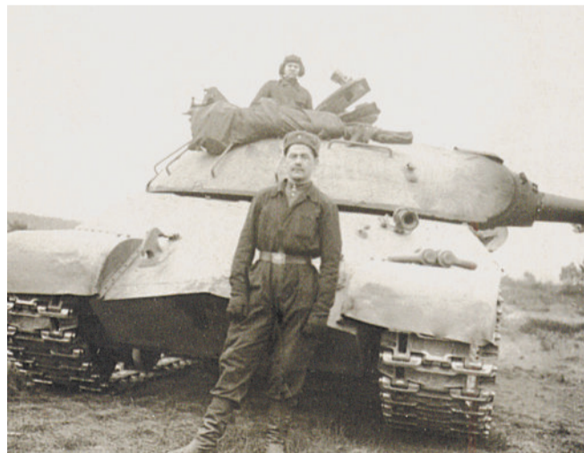
У БОЕВОЙ МАШИНЫ.

Выставка будет передвижной. Её можно будет увидеть на праздничных мероприятиях, посвящённых юбилею Победы.