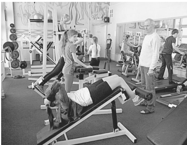
В ТРЕНАЖЁРНОМ ЗАЛЕ. ФОЦ «Златмаш» пользуется большой популярностью.

В физкультурно-оздоровительном центре (ФОЦ) АО «Златмаш» не бывает безлюдно: с раннего утра и до позднего вечера своё здоровье здесь укрепляют сотни златоустовцев. Детские учреждения образования Златоустовского городского округа в рамках социального партнёрства пользуются услугами ФОЦ на льготных условиях.