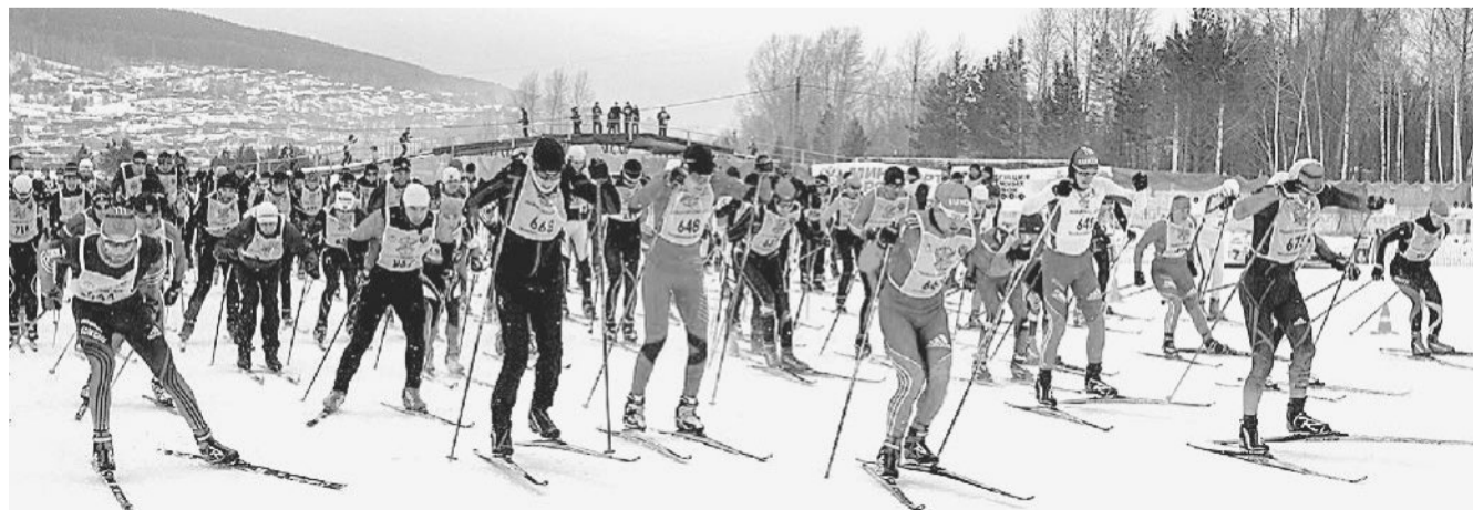
КТО ПЕРВЫЙ? Я! «Лыжня России» объединила спортивным единым порывом любителей и профессионалов.