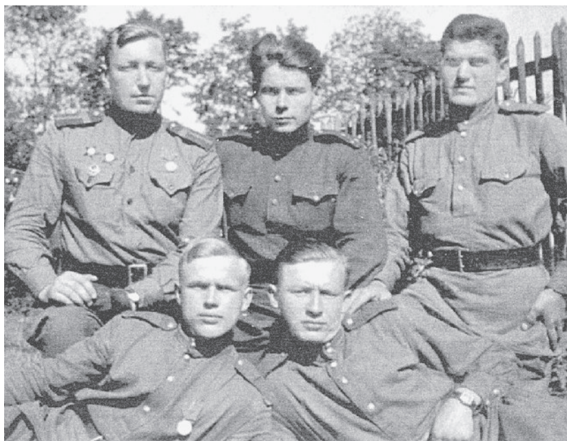
ДРУЗЬЯ-ОДНОПОЛЧАНЕ (фото из личного архива).

Памятные мероприятия приурочены к Дню защитника Отечества. Руководители, молодёжь, ветераны, работники АО «Златмаш», а также гости почтят память погибших бойцов, защищавших нашу Родину. Подобные патриотические акции пройдут по всей стране.