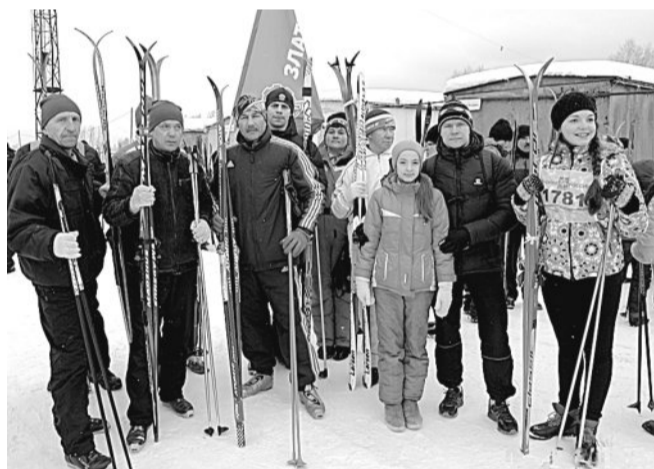
НА ЛЫЖНЮ! В первых рядах — машзаводчане.

спортивного праздника! Что может быть лучше, чем провести выходной не у телевизора, на диванчике, а на свежем воздухе, в хорошей компании!