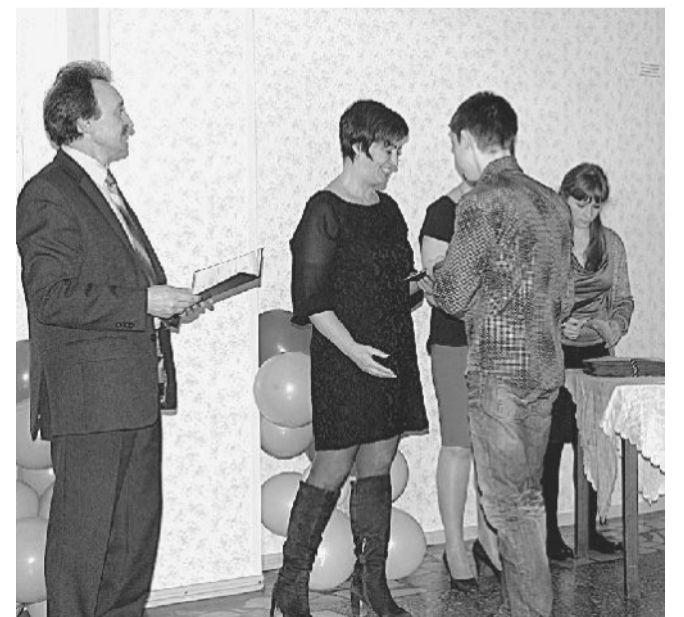
ПОЛУЧИЛИ ПРОФЕССИЮ. На выпускном «шоровцам» вручили дипломы об окончании учебного заведения.