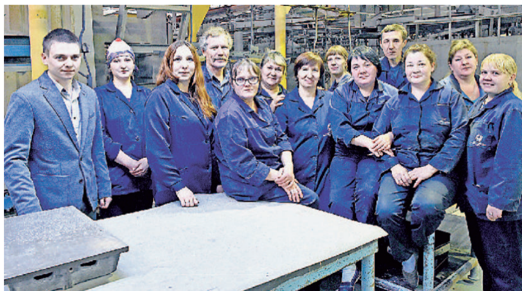
Участок эмалирования, покраски, сварки.

Совсем недавно это казалось невероятным, ведь в 90-е годы, когда останавливались и не такие производства, нашей «Мечте» тоже пророчили скорую гибель, а она не только выстояла, но и в те трудные годы стала главной кормилицей пред-